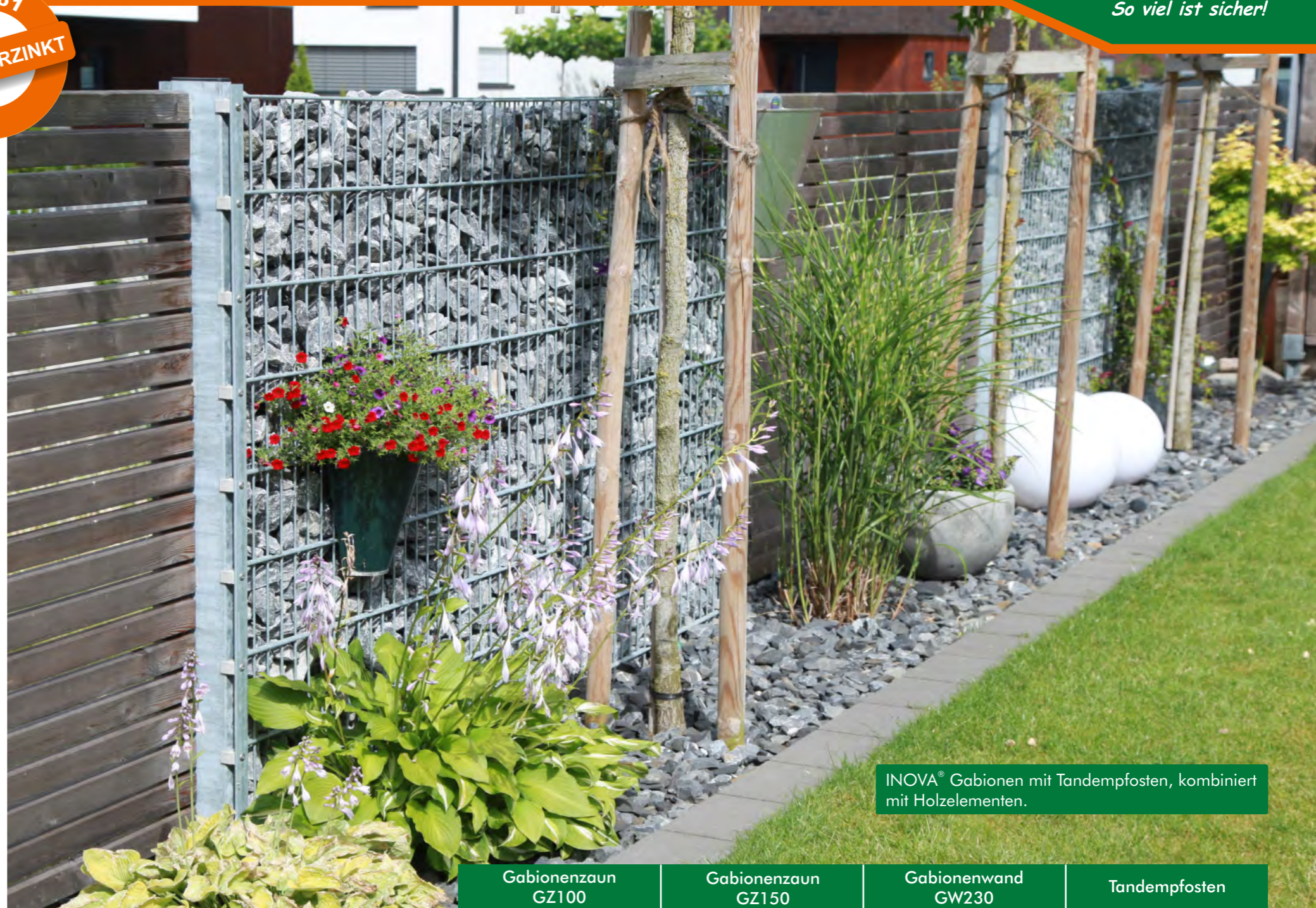
INOVA ® Gabionen mit Tandempfosten, kombiniert mit Holzelementen.

Innerhalb der Gabionen ist es möglich, interessante Muster oder sogar Lichteffekte zu gestalten. Ihrer persönlichen Kreativität sind dabei keine Grenzen gesetzt.